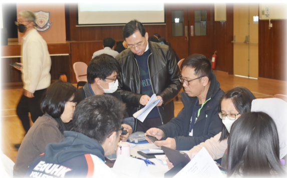
▲ 學校制定的發展計劃都是經過全體教師協商所產生，形成由下而上的改革動力，讓教師發揮所長並擁有歸屬感，建立一個能持續不斷學習的「教師專業學習社群」。

領導者要對教育有獨到的見解，並轉化成學校發展願景。靚中以「靚藝超群 創意飛揚 中外薈萃 夢想展翔」為主題，筆者透過嶄新的「3+3 年學校發展計劃」，帶領靚中全體師生在新學年落實「邁向有效學習、營造正向文化、追求卓越成就」(Leading to effective learning, Cultivating positive culture, Pursuing outstanding achievements)的目標，以提升學生知識、身心社靈正向發展及追求個人成就，達致全人發展。一般學校是採用三年發展計劃來規劃學與教和學生培育的方針，然而許多措施要通過長時間的實踐，持續連貫地推行才能看到成果。而靚中的「3+3」方案，以六年為一貫完整的發展體系，貫穿學生整個中學生涯，確保學生學習品質。學校制定的發展計劃經過全體教師協商產生，並因應實際校情、學生能力和需要而設計，並非校長一人決定。成功的校長要懂得將權力下放，形成由下而上的改革動力，讓教師發揮所長並擁有歸屬感，在適當時間給予支援和方向，建立一個能持續不斷學習的「教師專業學習社群」。