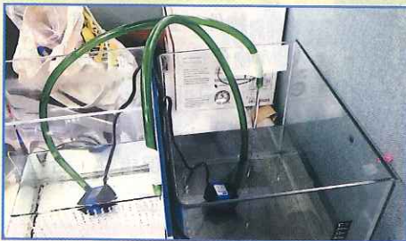
● 利用水底水泵抽水。