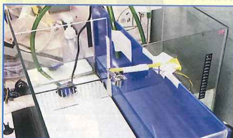
● 以超聲波測距器測量水面與測距器之間的距離以監控換水量。