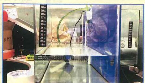
● 兩個水泵分別由Arduino編程控制開關以確保準確的換水量。